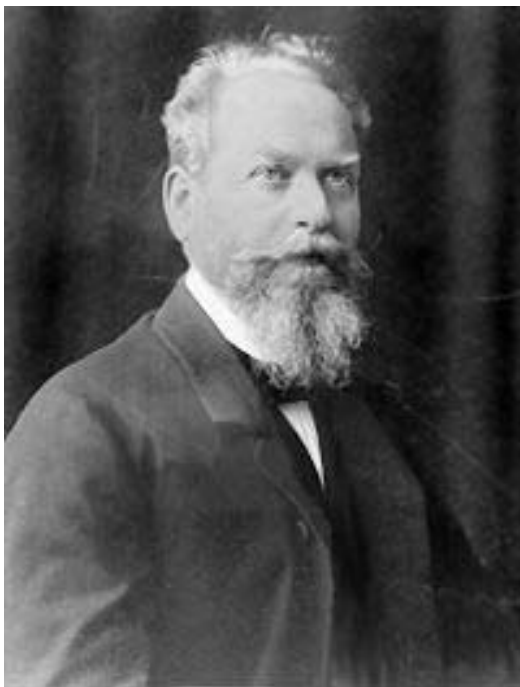
Edmund Husserl (1859-1938)

Una de las corrientes filosóficas contemporáneas mas estudiadas y discutidas en foros académicos y profesionales, es sin duda la Fenomenología expuesta y defendida por Edmundo Husserl en la primera mitad del pasado siglo XX y aún vigente en el interés de los estudiosos.